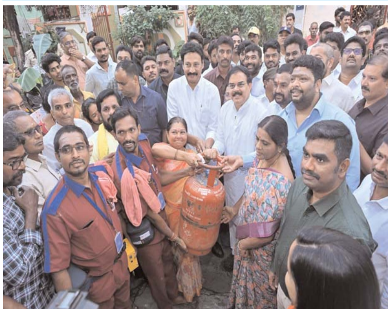
శాసనసభ్యులు గద్దె రామ్మోహన్ మాట్లాడుతూ కట్టెల పొయ్యితో వంట చేస్తూ మహిళలు పడుతున్న ఇబ్బందులను గుర్తించి నాడు సీఎంగా ఉన్న చంద్రబాబు నాయుడు దీపం పథకాన్ని తీసుకొచ్చారన్నారు. ఇప్పుడు దీపం -2 పథకం ద్వారా 21 రోజుల్లోనే 50 లక్షల మందికి లబ్ధి చేకూరడం సంతోషంగా ఉందన్నారు. అతి తక్కువ ఫిర్యాదులు నమోదు కావడం ఈ పథకం అమలు పారదర్శకతకు నిదర్శనం అన్నారు.

రాష్ట్ర పౌర సరఫరాలు, అహారం, వినియోగదారుల వ్యవహారాల శాఖ మంత్రి నాదెండ్ల మనోహర్ జగన్ మోహన్ రెడ్డి కావాలనే దీపం-2 పథకంపై దుష్ప్రచారం గ్యాస్ కంపెనీలు ఇచ్చిన అభికాలక లెక్కల ప్రకారం రాష్ట్రంలో 1 కోటి 55 లక్షల 200 ల గ్యాస్ కనెక్షన్లు దీపం-2 పథకంపై దుష్ప్రచారం ప్రచారాలను ప్రజలు సమ్మోద్యు అర్చనలై నచలల అబ్బిదారు వరకు ఉచిత గ్యాస్ సిలిండర్ల పంపిణీ చేస్తాం మహిళల ఆరోగ్య భద్రత కూటమి ప్రభుత్వ లక్ష్యం రాష్ట్రంలో విజయవంతంగా అమలువుతున్న ఉచిత గ్యాస్ సిలిండర్ల పథకం అత్యంత పారదర్శకంగా, నిజాయితీగా పథకం అమలు