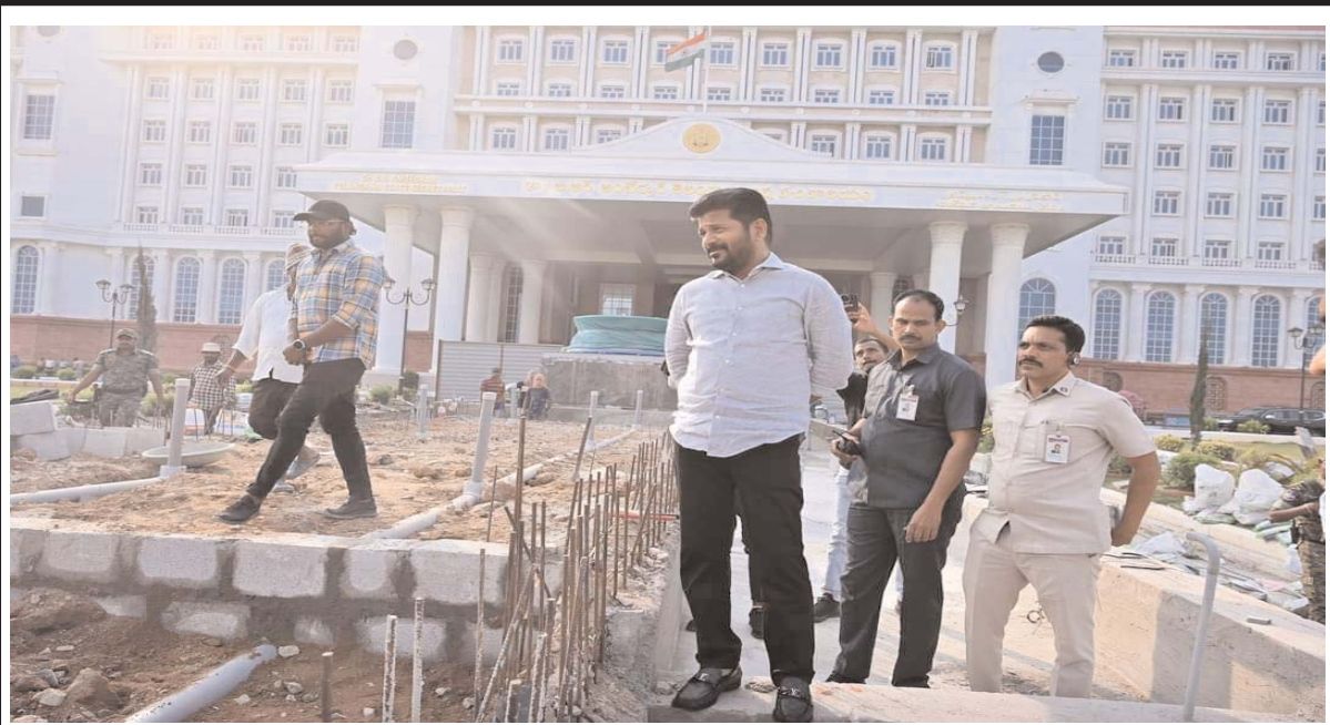
సచివాలయ ప్రజాబలం ప్రతినిధి: డాక్టర్ బీఆర్ అంజేద్ దర్ రాష్ట్ర సచివాలయ ప్రాంగణంలో తెలంగాణ తల్లి విగ్రహ ఏర్పాటు కోసం జరుగుతున్న పనులను ముఖ్యమంత్రి రేవంత్ రెడ్డి పరిశీలించారు. డిసెంబర్ 9 న విగ్రహాన్ని ఆవిష్కరించాలని నిర్ణయించిన నేపథ్యంలో పనుల పురోగతిని పరిశీలించారు. ఆక్రమ పని చేస్తున్న వారిని పలకరిస్తూ వారి బాగోగులను అడిగి తెలుసుకున్నారు.