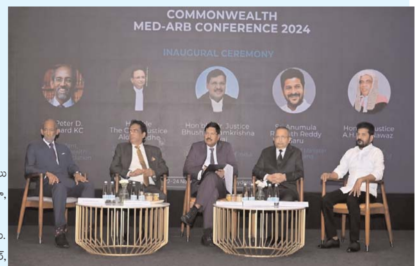
COMMONWEALTH MED-ARB CONFERENCE 2024 INAUGURAL CEREMONY

సామాన్యులకు, చిన్న సంస్థలకు కూడా ఆర్బిట్రేషన్ మీడియేషన్ సేవలు అందుబాటులో ఉండాలని ముఖ్యమంత్రి రేవంత్ రెడ్డి అన్నారు. హైదరాబాద్ లో ప్రారంభమైన కామన్వెల్త్ ఆర్బిట్రేషన్ మీడియేషన్ సదస్సు 2024 లో పాల్గొని ప్రసంగించారు. మధ్యవర్తిత్వం నెరవేరడం ద్వారా సమస్యల పరిష్కారానికి ఇంటర్నేషనల్ ఆర్బిట్రేషన్ అండ్ మీడియేషన్ సెంటర్ చేస్తున్న కృషిని ముఖ్యమంత్రి గారు అభినందించారు. చర్చలు, సంప్రదింపులు, మధ్యవర్తిత్వం వల్ల వివాదాలు వీలైనంత తొందరగా పరిష్కరించుకోవడానికి అవకాశం ఉందని అన్నారు. అందుకు కృషి చేస్తున్న ఐఎఎస్ సేవలు గ్రోబల్ ఇన్వెస్ట్మెంట్స్, పెద్ద పారిశ్రామిక వేత్తలకి పరిమితం కాకుండా సామాన్యులకు కూడా అందుబాటులోకి రావాలని సీఎం కోరారు.