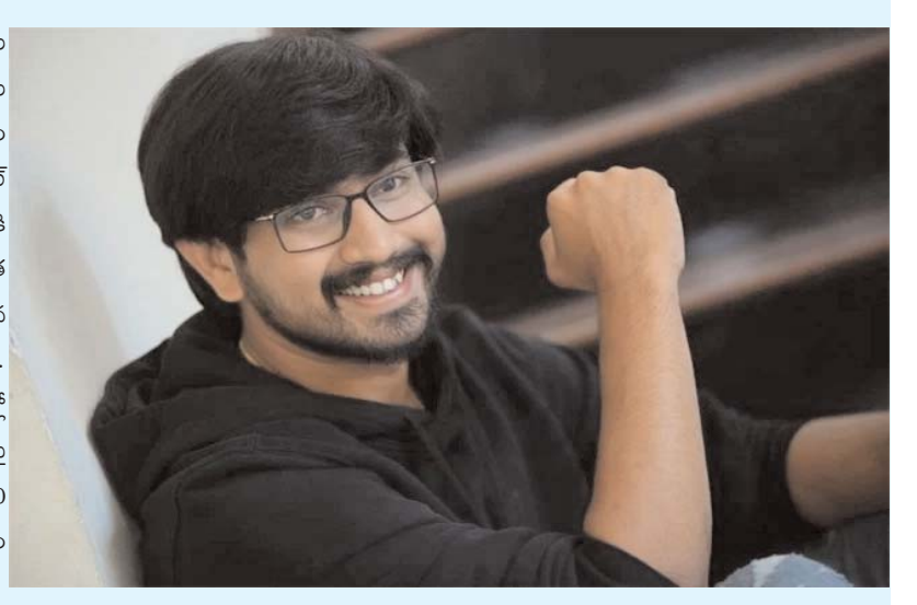
బియాండ్ ఫెస్టివల్ ఎన్టీఆర్ 'దేవర'