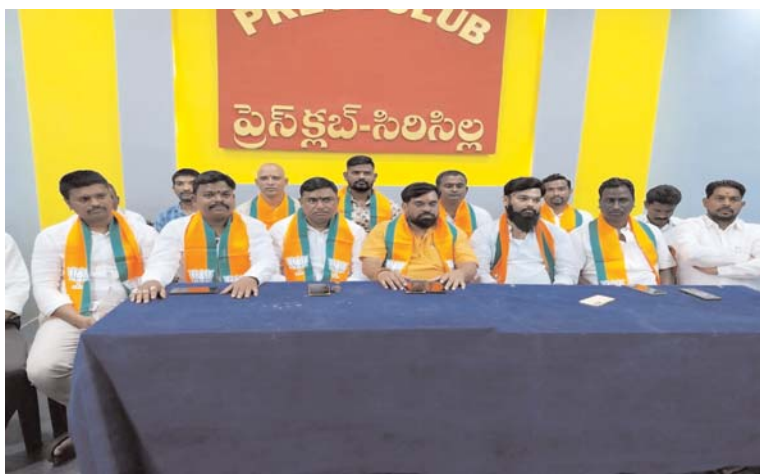
రాజ రాజన్న సిరిసిల్ల జిల్లా, 29 ఏప్రిల్ 2024, ప్రజాబలం ప్రతినిధి

మొన్నటి రోజున పొన్నం ప్రభాకర్ రాష్ట్ర మంత్రి బట్టల పై GST వేస్తుంది ఈ కేంద్ర ప్రభుత్వం బిజెపి వచ్చే జీఎస్ ట్యాక్స్ చేసింది అని చెప్పింది. జిఎస్ ట్యాక్స్ అనేది గతంలో కాంగ్రెస్ ప్రభుత్వం ఉన్నప్పుడు నుంచి ప్రజాజల పెడతానే ఉన్నారా వాళ్ళతోనే ఇంప్రూవ్మెంట్ చేయడం వాళ్ళ పట్ల చేతకాలే మనోహర్ సింగ్ అధ్యక్షతన ఇది ఇంప్లిమెంట్ చేయడానికి ప్రయత్నాలు జరిగినాయి వాళ్ళతోనే చేతకాకుండా పక్కకు పడిన దాన్ని సరేంద్ర మోడీ దాన్ని కంప్లీట్ గా అమలు చేసింది అని మీకు తెలియజేస్తున్న పొన్నం ప్రభాకర్ గత రాష్ట్ర ప్రభుత్వం %౧౫% రిఫండ్ ఇయ్యాలే ఇప్పుడు మరి మీరు ఇస్తున్నారా ఇస్తేలా తెలుపది అదేదో నా పాత బకాయిలు ఏన్నీ ఉంటే అన్నీ మీరు వ్యాపారులకు వెంబడి 7% %౧౫% రిటన్ ఇచ్చి మీరు ఏదైనా చెప్పాలే లేకపోతే ఈ రాష్ట్ర ప్రభుత్వము GST టెక్సెట్ పై తీసేస్తున్న అని ప్రకటించి %౧౫% కౌన్సెల్ కు ఒక లెటర్ ముఖ్యమంత్రి చే రాయించి GST పూర్తి భరించడానికి రాష్ట్ర ప్రభుత్వం సిద్ధంగా ఉన్నదని ఒక లెటర్ రాసిన తర్వాత %౧౫% మీద పొన్నం ప్రభాకర్ మాట్లాడాల్సింది. పొన్నం ప్రభాకర్ GST గురించి మాట్లాడుతాడు గాని ఆయనకు