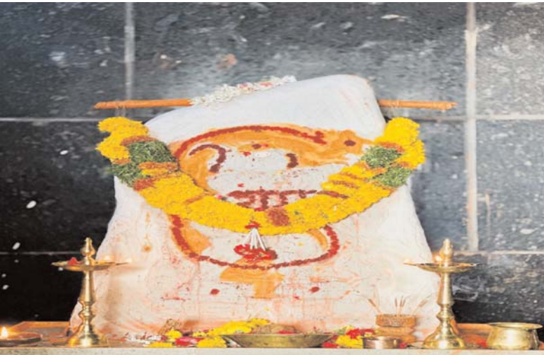
తూప్రాన్, ఏప్రిల్, 22 ప్రజాబలం న్యూస్ :- ప్రకృతి రమ నీయమైన చెరువు నీళ్లు పక్కన వచ్చి తూప్రాన్ వీరాంజనేయ స్వామి అలయ మందిరం జయంతి ఉత్సవాలు హనుమాన్ మాలదరణ మండల దీక్ష స్వాముల మధ్య

తూప్రాన్ వీరాంజనేయ స్వామి అలయం వద్ద జయంతి ఉత్సవాలు ఘనంగా జరుగుతున్నాయి. రామనామ స్మరణతో జపము ప్రదక్షణ అలయ మందిరం రామనామ ఆంజనేయ స్మరణతో ప్రశాంత వాతావరణంలో రామనామ స్మరణతో మనసంతా రంజింప చేస్తుంది. అలయ అర్చకులు హనుమాన్ గురుస్వామి సలాక ఆశ్రయ శర్మ మాట్లాడుతూ దశాబ్దాల జీవన సమరంలో అలసి సొలసిన వారికి అలంబన ఇచ్చే ఆధ్యాత్మిక క్షేత్రం అని ఇప్పటికీ కులమత బేధములు లేకుండా స్వామివ జయంతి ఉత్సవాలు ఆశేష భక్తుల మధ్య ఇక్కడ ఘనంగా జరుపుతున్నామని తెలిపారు. జయంతి ఉత్సవం సందర్భంగా 21. 4. 2024 ఆదివారం క్రోధి నామ సంవత్సర చైత్ర శుద్ధ త్రయోదశి ఉదయం గణపతి పూజ పుణ్యం పుణ్యహవాచనం అఖండ దీపారాధన అంకురార్చనము సుందరకాండ గురు చరిత్ర పారాయణంలో ప్రారంభము మన్యునూక్త పాప పతము, సీతారామ లక్ష్మణ విగ్రహాలకు అభిషేకం , తీర్థ ప్రసాద వితరణ,22- 4- 2024 సోమవారం నాడు సంవత్సర చైత్ర శుద్ధి చతుర్దశి రోజున గణపతి నవగ్రహ రుద్ర పంచనూక్త మన్యునూక్త లక్ష్మీ హోమంబులు,