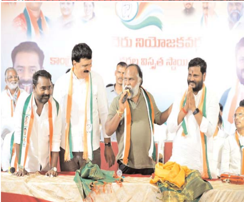
నంగారెడ్డి ఏప్రిల్ 18 ప్రజ బలం ప్రతినిధి: లివటాన్ చెరు లో కాంగ్రెస్ పార్టీ