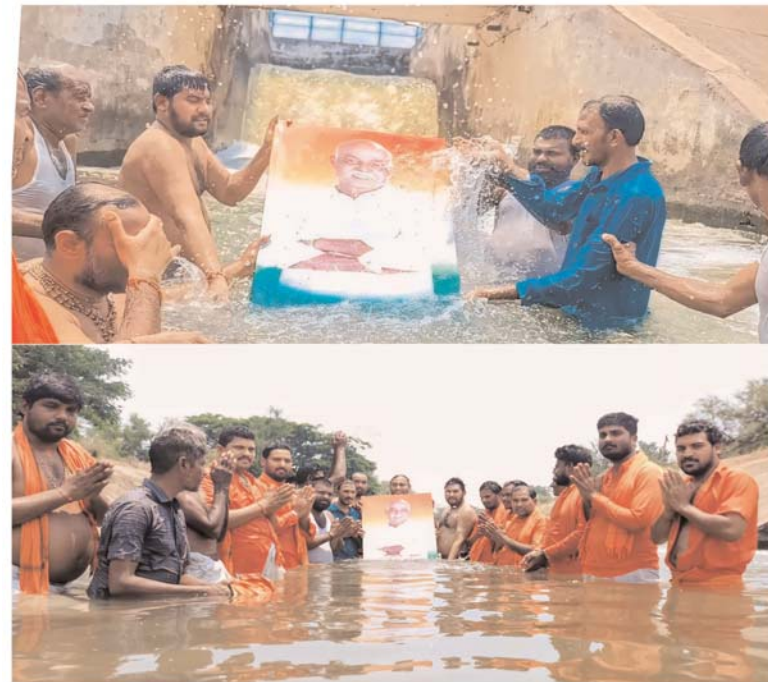
గ్రామంలో నాయకులు వివిధ గ్రామాల ప్రజలు కార్యక్రమం తదితరాలు పాల్గొన్నారు.