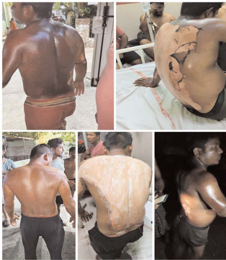
గూడూరు నగర పంచాయతీలో ఏమ్మిగనూర్ రోడ్ లో వున్న 132/83ఎల సబ్ స్టేషన్ లో నిన్న రాత్రి 8 గంటల సమయంలో ప్రాజెక్ట్ ట్రాన్స్ఫార్మర్ పేలి నలుగురు గాయాల పాలయ్యారు. సబ్ స్టేషన్ లో ట్రాన్స్ఫర్మర్ లోడ్ ఎక్కువ కావడం వల్ల పేలింది. ఈ సంఘటనలో పని నిమిత్తం వచ్చిన టీహెచ్ కూలీలకు తీవ్ర గాయాలయ్యాయి. వీరిని చికిత్స నిమిత్తం కర్నూల్ ప్రభుత్వ ఆస్పత్రికి తరలించారు